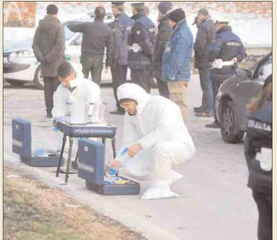
Milano, vigile uccide cileno durante inseguimento. È indagato per eccesso di difesa

Un lungo, interminabile, elenco con migliaia di nomi di persone morte o ammalate a causa dell'amianto, e di loro parenti e congiunti. È l'elenco di coloro che hanno il diritto a essere risarciti per i danni che hanno subito a causa dell'amianto. Lo ha stilato il Tribunale di Torino nel dispositivo della sentenza di condanna. Per leggerlo tutto il Presidente del Tribunale di Torino ha impiegato tre ore, in un'aula gremita, con centinaia di persone in piedi, in un silenzio assoluto, carico di emozione. Un elenco meticoloso e preciso, «un rosario infinito» che ha attraversato tutta l'Italia e ha fatto rivivere nell'aula del Tribunale di Torino «il dramma collettivo dell'amianto», per usare le parole del Presidente della Provincia di Torino, Antonio Saitta. «Con la sentenza abbiamo realizzato il sogno di dare giustizia a molte famiglie» ha detto il pm Raffaele Guariniello, alla fine della lettura della sentenza del processo.