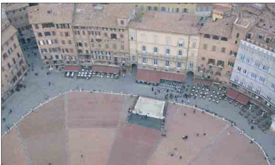
IN CENTRO Piazza del Campo a Siena

Delusione per i tifosi giallorossi che hanno invaso Siena, arrivati anche dalla Toscana e dall'Emilia Romagna. In mattinata l'incontro con i giocatori a Piazza del Campo, che però resta uno dei pochi ricordi piacevoli